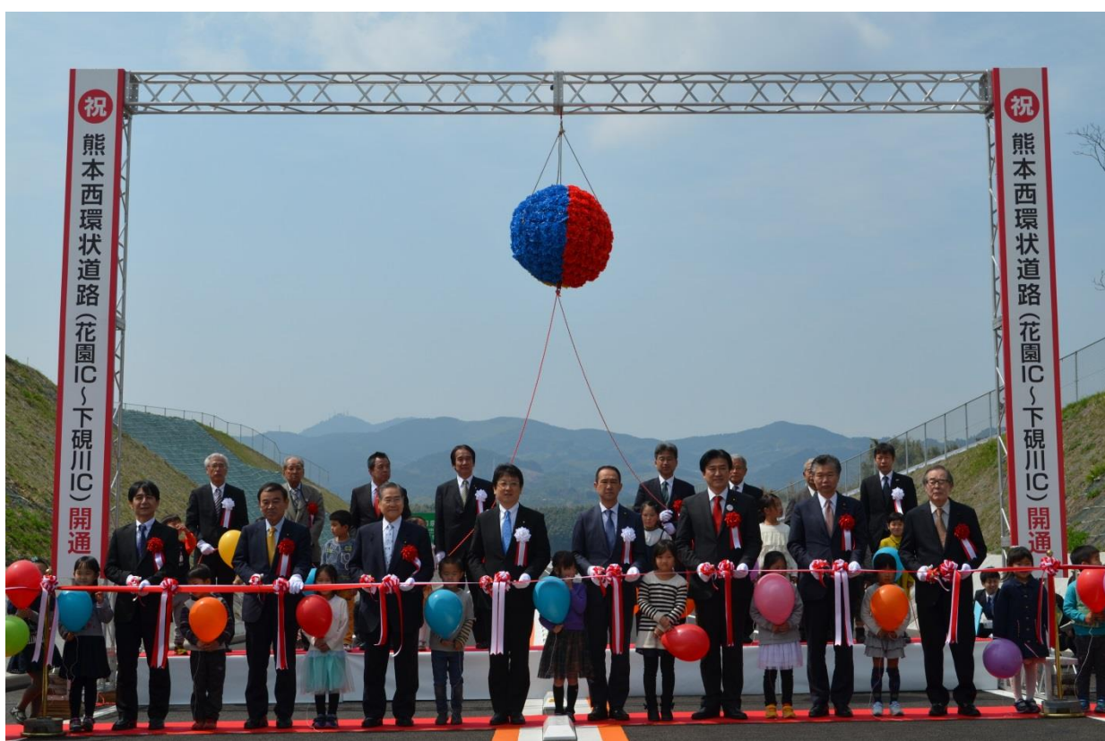
熊本西環状道路（花園 I C～下硯川 I C）開通式（H29.3.26）